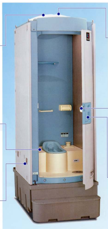
TU-P(兼用)ポンプ式簡易水洗

◆ドア鍵・取手 施設の有無が赤と青の色彩表示により視覚的に確認できます。また、ドア取手も本体にスッキリと納まったデザインで、開閉がしやすくなりました。